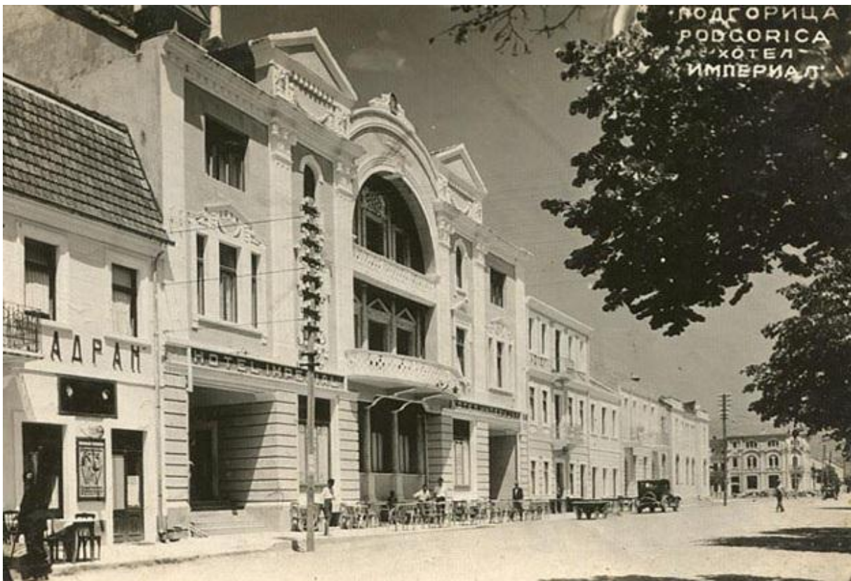
6. Hotel »Imperial« - Podgorica

Bio je to period početka industrijalizacije i intenzivne gradnje, a iskustva za tako nešto, uz manjak kadrova - skoro da nije bilo.