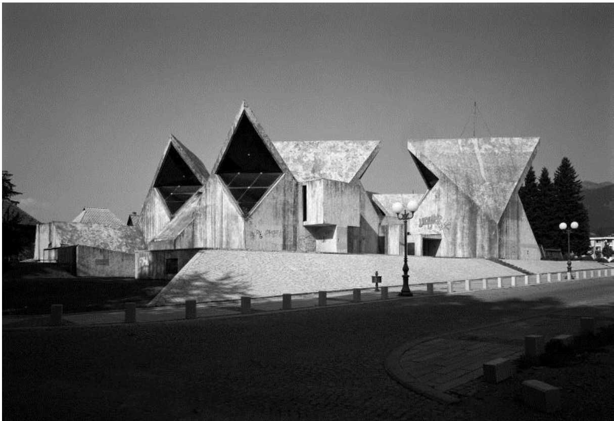
18. »Spomen dom« - Kolašin (M. Mušič)