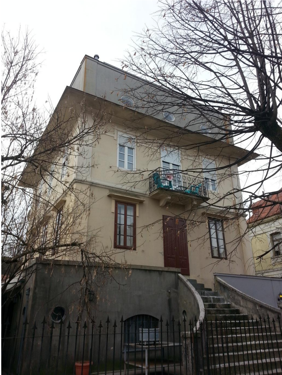
4. »Kuća Vukotića« - Cetinje (Jovan Maguljani)

Cetinjska »kvadratna kuća« (vele da su je tako prozvali Cetinjani) nastala je i samo 4-5 godina poslije Loos-ove »Villa Karma« (fotografija br. 5) u Clarens-u, Švajcarska (1904-1906.) - kuće, koja je, zarad svoje geometrijske jednostavnosti, proslavila autora.