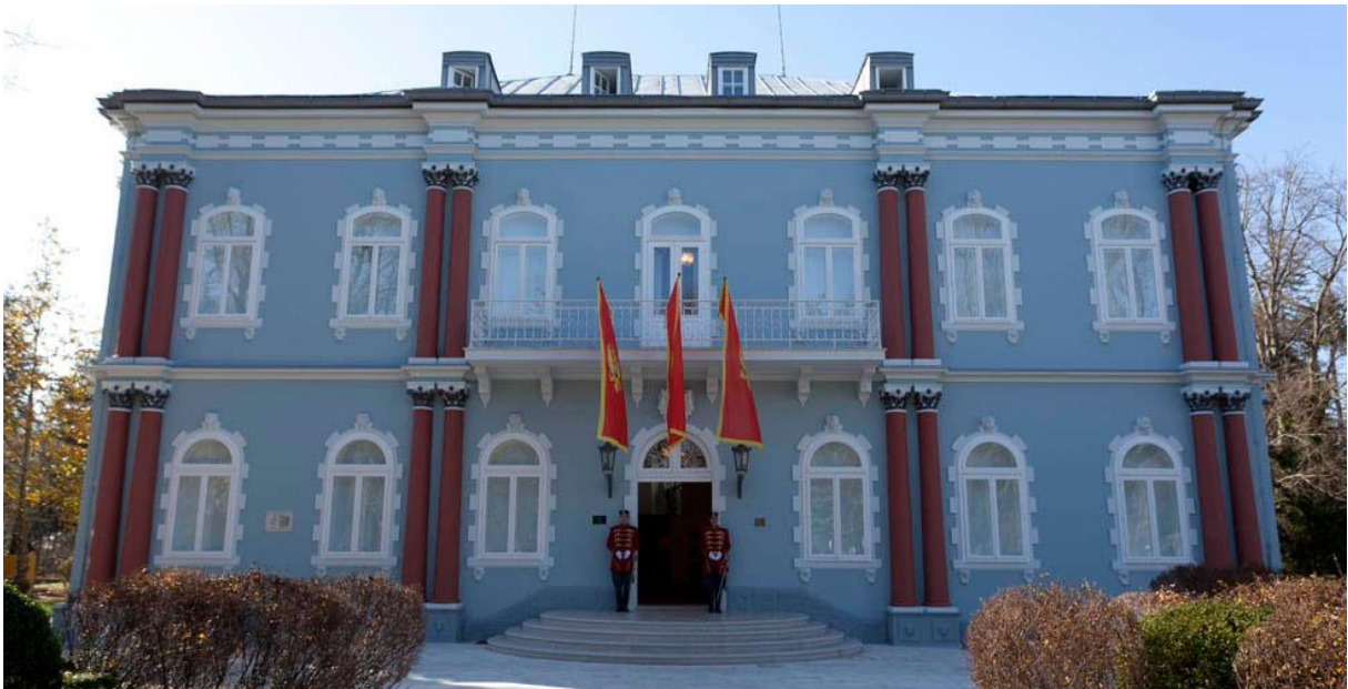
2. »Plavi dvorac« - Cetinje