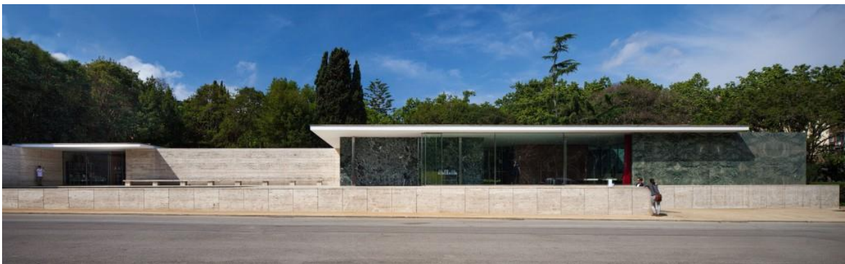
25. »Barcelona Pavilion« - Španija (Ludwig Mies van der Rohe)

Danas imamo i, opetujem, opstaće decenijama još neminovni savremeni internacionalni stil 21-og stoljeća - kroz koji je (praktično) sve već u arhitekturi rečeno. Da budem još konkretniji: sve su u suštini davno »rekla« dva genija - Le Corbusier i Mies van der Rohe (Mis van der Roë) - (»Barcelona Pavilion« - Španija (fotografija br. 25)).