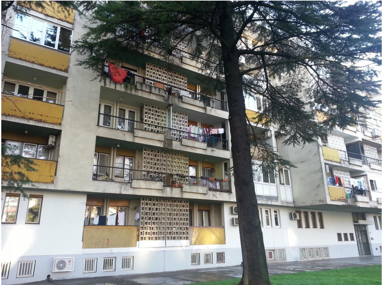
12. Stambena zgrada na Bulevaru Sv. Petra Cetinjskog - Titograd (J. Milošević)

Stambene i/ili stambeno-poslovne zgrade - u Titogradu - u ulici Ivana Milutinovića i na Bulevaru Svetog Petra Cetinjskog (fotografija br. 12) - (J. Milošević), odmah do prijetodne na Bulevaru Svetog Petra Cetinjskog (fotografija br. 13) i u ulici Svetozara Markovića (istovjetna kao u ulici Vasa Raičkovića) - (M. Vukotić), »Vojnička zgrada« u centru (S. Fabris), »Zgrade Duklje« (P. Muličkovski), tri istovjetne »Kocke« u ulici »13. jula« (A. Martinović), u ulici Novaka Miloševa (I. Šćepanović), u ulici Ivana Vujoševića i na Bulevaru revolucije (fotografija br. 14) - (P. Dmitrović), »Blok 5« (M. Bojović) i - u Budvi - u Mediteranskoj ulici (N. Jovović);