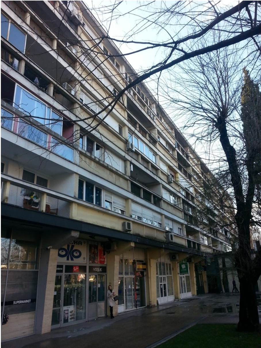
13. Stambeno-poslovna zgrada na Bulevaru Sv. Petra Cetinjskog - Titograd (M. Vukotić)