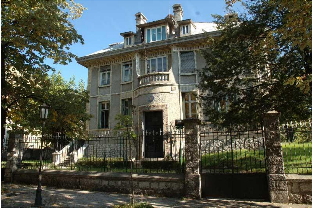
3. Francusko poslanstvo - Cetinje (Auguste Perret)

Jedino je »šarmantna« kuća bivše Francuske ambasade (fotografija br. 3) - (Auguste Perret (Ogist Pere)) izgrađena u stilu secesije i - najznačajnije je secesijsko djelo pri nas.