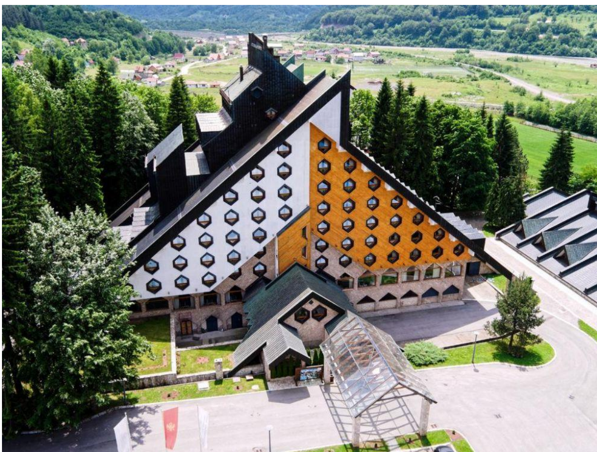
11. Hotel »Bianca Resort & Spa« - Kolašin (R. Zeković)