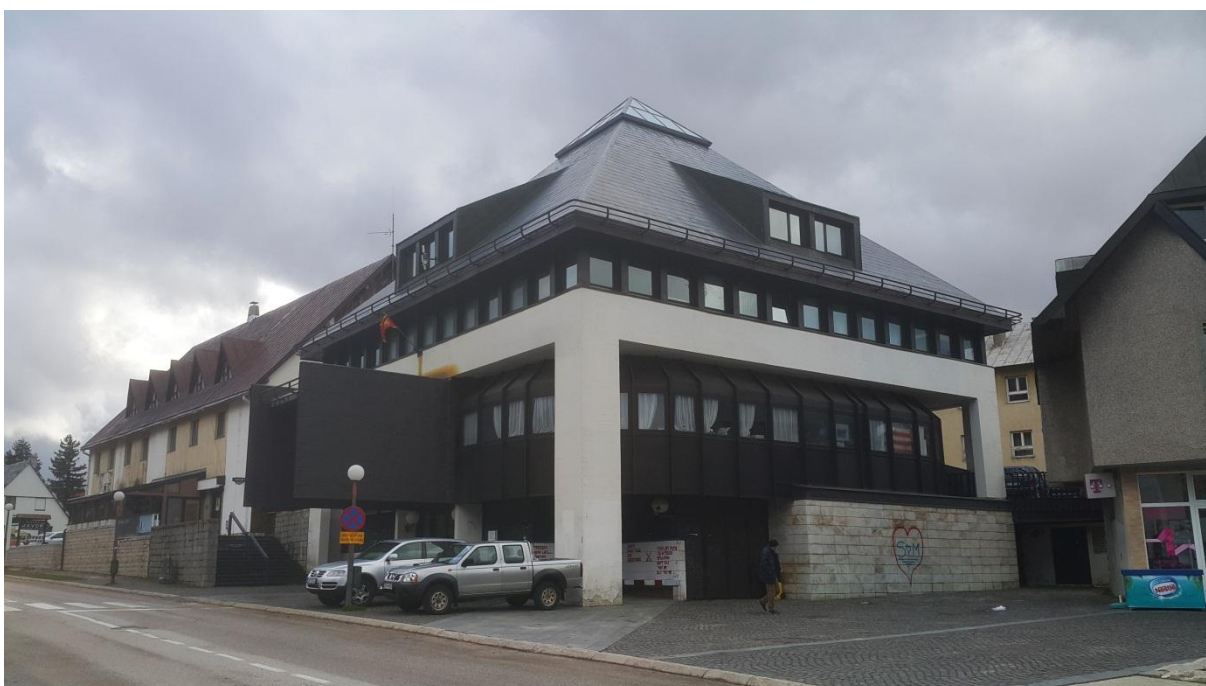
17. Centralna banka Crne Gore (»Stožina«) - Žabljak (M. Bojović)

Namjerno izdvojeno dodajem - fenomenalni »Spomen-dom« u Kolašinu (fotografija br. 18) - (M. Mušič). Šteta je što materijalizacija ove kuće nije mogla biti (još) kvalitetnija. No, ono što je ili što znači »Sydney Opera House« (fotografija br. 19) - (Jørn Utzon (Jern Ucon)) - na planetarnom nivou, to je (za mene) u više ravni, »Spomen-dom« u Kolašinu - za Crnu Goru. Mimogred otkrito rečeno, o »Domu revolucije« u Nikšiću, istoga autora - mnim taman sve suprotno od njegove »kolašinske kuće«, znači - negativno, kao i o preklanjskom »pobjedničkom« konkursnom radu za stavljanje u funkciju ili oživljavanje ovoga »kućišta«.