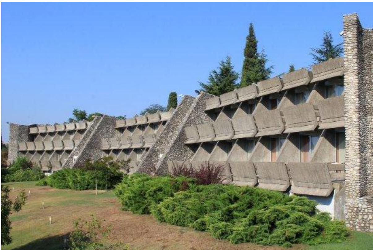
10. Hotel »Podgorica« - Titograd (S. Radević)