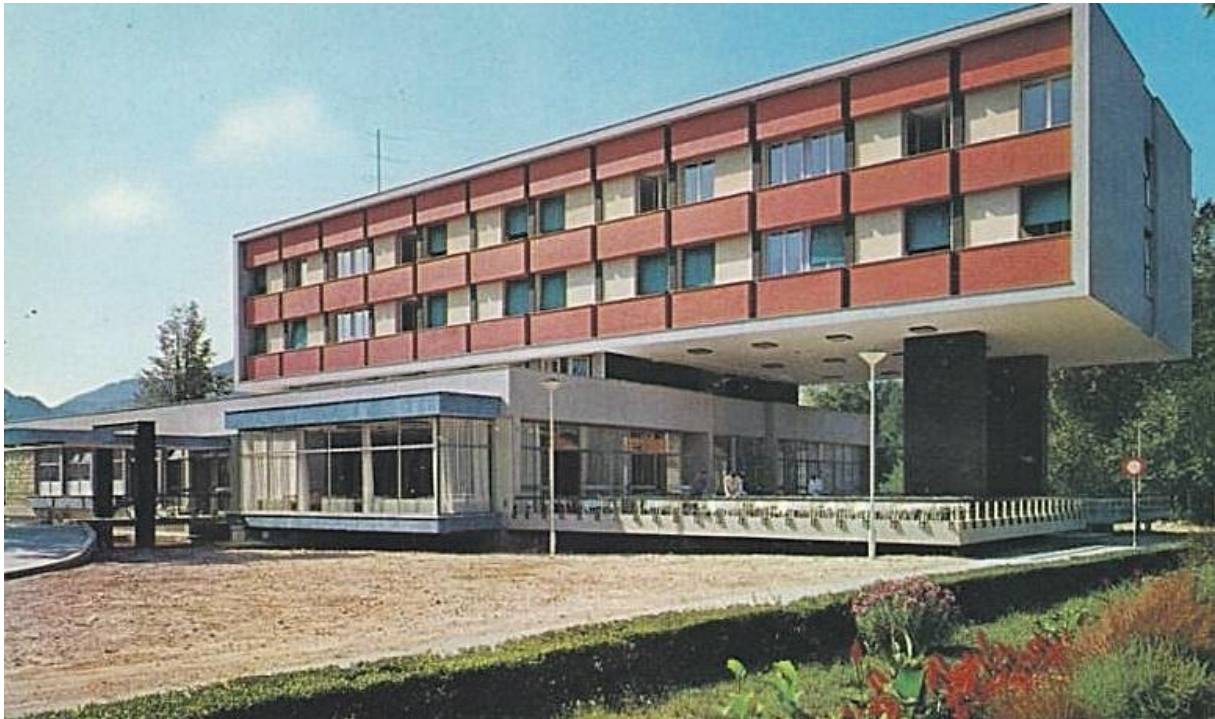
9. Hotel »Park« - Cetinje (V. Janković)

Hoteli - »Park« na Cetinje (fotografija br. 9), koji je bez ičesove preše (potrebe) oburdan poslije zemljotresa 1979. (V. Janković), »Maestral« na Pržno (E. Ravnikar), »Podgorica« u Titogradu (fotografija br. 10) - (arhitektica S. Radević), »Bjelasica« (danas »Bianca Resort & Spa«) u Kolašinu (fotografija br. 11) - (R. Zeković), »Plavsko jezero« u Plavu (N. Drakić) i »Slovenska plaža« u Budvi (J. Kobe);