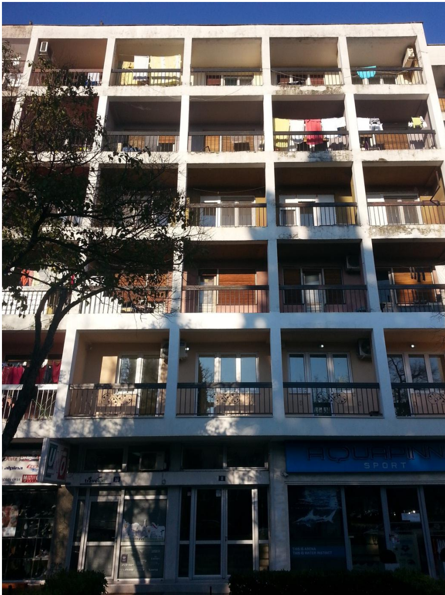
14. Stambeno-poslovna zgrada na Bulevaru Revolucije - Titograd (M. Dmitrović)

Školske i druge zgrade - u Titogradu - »Osnovna škola - Maksim Gorki« (M. Popović), "Plaža Galeb" (V. Vukotić), Katolička župna crkva (Z. Vrkljan i B. Krstulović), »Novinsko javno preduzeće - Pobjeda« (fotografija br. 15) - (I. Šćepanović), »Robna kuća« na Trgu nezavisnosti (B. Milić), »Kliničko-bolnički centar Crne Gore« (fotografija br. 16) - (B. Milić i M. Popović), »Centralni komitet Saveza komunista SR Crne Gore« (R. Zeković) - u Herceg Novom - Pošta (N. Dobrović) - na Žabljaku - »Centralna banka Crne Gore« (fotografija br. 17) - (M. Bojović) i - u Budvi - »Osnovna škola - Stefan Mitrov Ljubiša« (A. Keković).