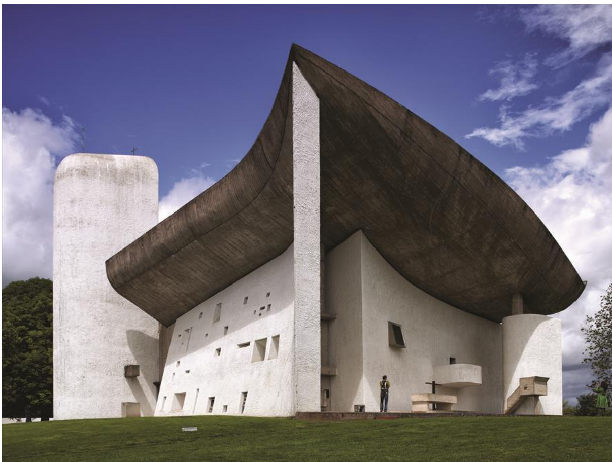
24. Chapelle Notre-Dame-du-Haut de Ronchamp - Francuska (Le Corbusier)

Ovdje s razlogom podvlačim - hrišćanske provenijencije, jer u okviru toga želim naglasiti, da predmetno - apsolutno nimalo ne važi za hrišćansku pravoslavnu sakralnu arhitekturu! Ali - to je tema za nekoju drugu (potanku) analizu.