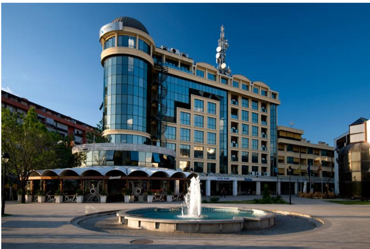
21. Poslovno-stambana zgrada »Telenor« - Titograd (P. Popović)