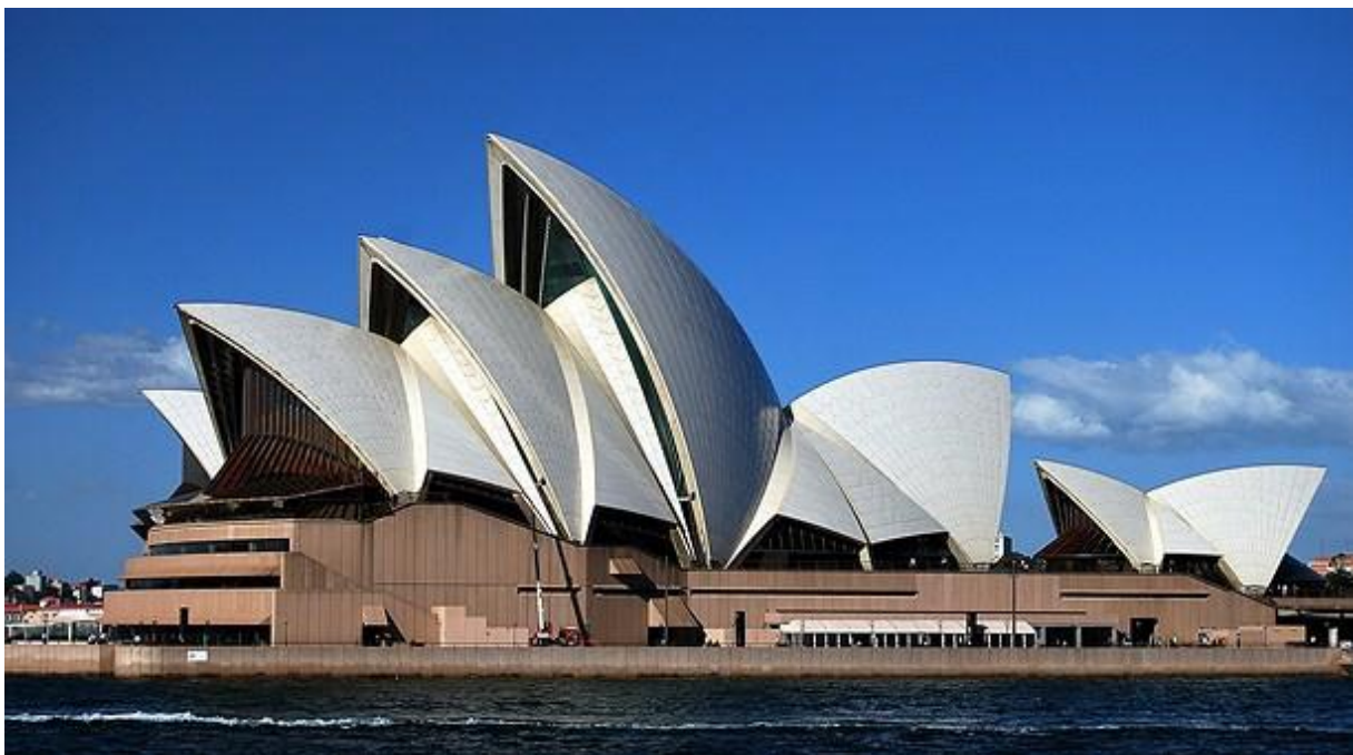
19. »Sydney Opera House« - Australia (Jørn Utzon)