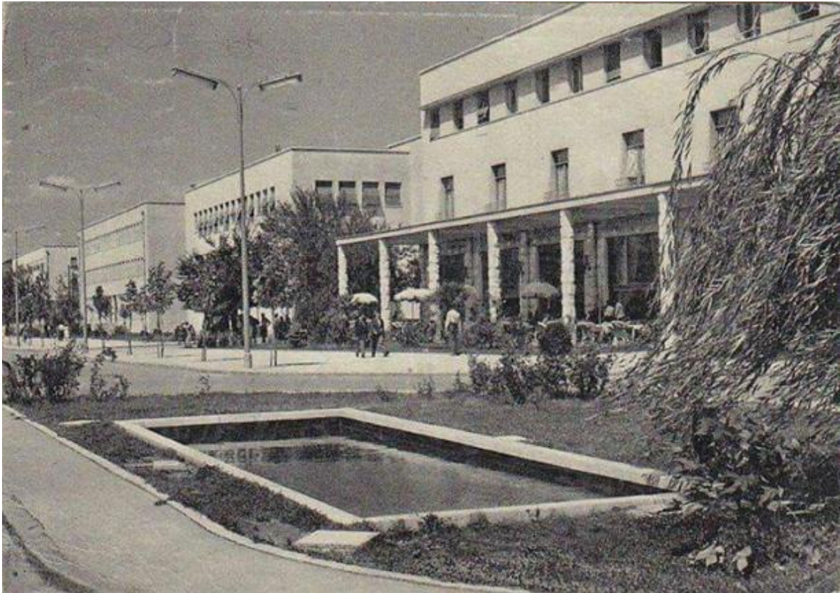
7. »Pošta 1« i Hotel »Crna Gora« - Titograd (V. Popović)

Prvi i pravi uzlet u modernoj crnogorskoj arhitekturi i najznačajnija djela u tom periodu, stvara arhitekt Vujadin Popović («Grand-hotel Crna Gora», «Pošta 1» (fotografija br. 7) i ugaona stambeno-poslovna kuća knjižare «Kultura», na današnjem Trgu nezavisnosti).