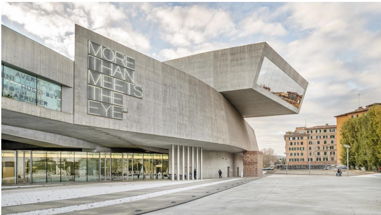
26. »MAXXI Museum« - Rim, Italija (Zaha Hadid)

Tako dođoh do pitanja: inspiracije, imitacije i doslovnog »kopiranja« ili krađe tuđih ideja. Kako je u arhitekturi već skoro sve »izmišljeno« i samo će se, što je neizbježno, a normalno i legitimno - ideje i dalje »uzimati-posuđivati« od velikih arhitekata (glede na afinite i stručnu osposobljenost onih koji ih »uzimlju-posuđuju«) - jedino je nivo inspiracije (uslovno rečeno) »dopušten«.