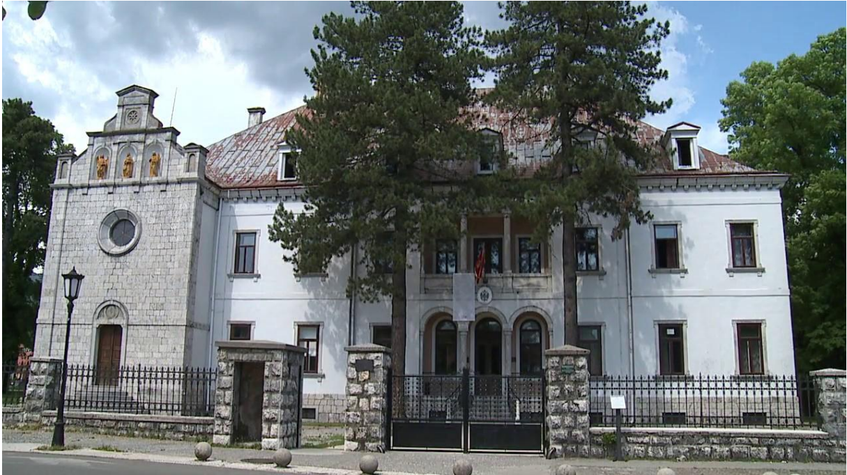
1. Austro-Ugarska ambasada - Cetinje (J. Slade-Šilović)