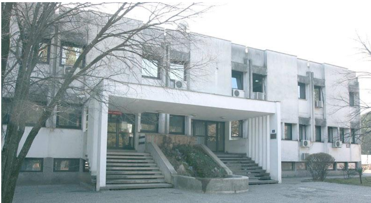
15. NJP »Pobjeda« - Titograd (I. Šćepanović)