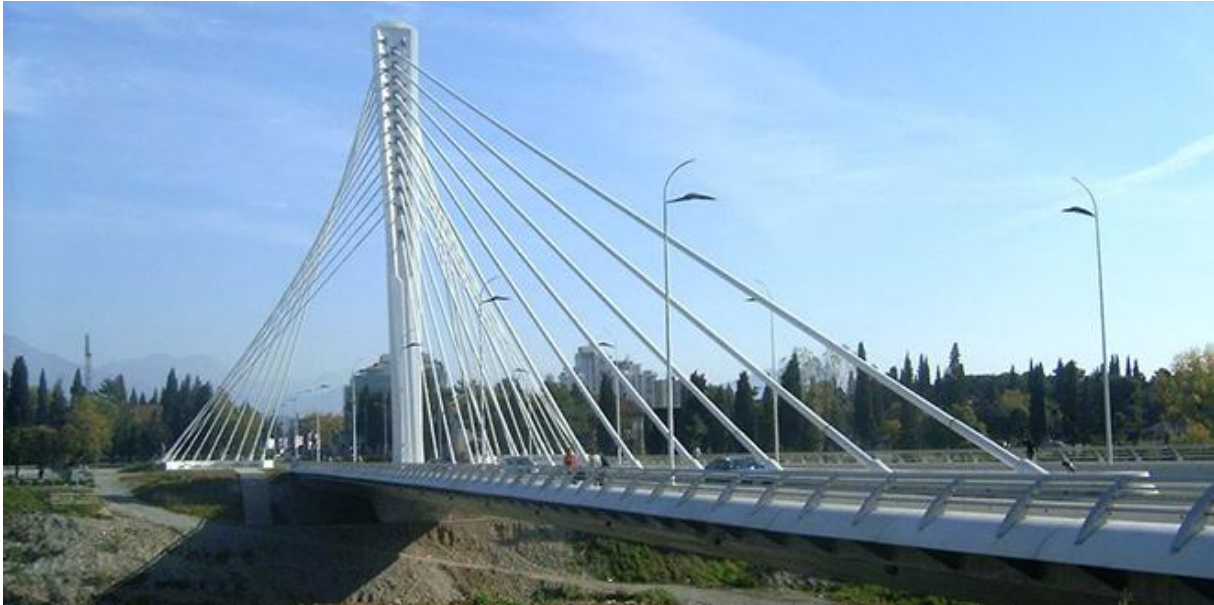
23. Most »Mileni(j)um« - Titograd (M. Ulićević)

Međutijem - iako ovo jest period u kojemu smo se litrosili (otarasili) post-moderne i tako konačno avizali (osvijestili) u struci - doba su kad crnogorska savremena arhitektura silno zaostaje za arhitekturom po svijetu.