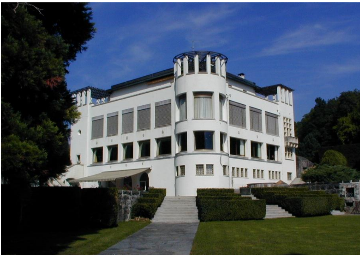
5. »Villa Karma« - Clarens, Švajcarska (Adolf Loos)

Kad sam već ovđe želim napisati da - ako je uopšte moguće (a jest) jednom kućom i njenim uplivom, označiti početak »skoro svega u arhitekturi« 20. stoljeća, onda je to (za mene) upravo spomenuta »Villa Karma«. U odnosu na mnogo toga važnijeg i šireg u modernoj arhitekturi, kad je značaj, takoreći, »pred-kubističke« arhitekture ove vile u pitanju - ne želim propustiti još jedan subjektivni utisak: viđu lijepo đe je i na kojojzi kući, sjajni Richard Meier (Ričard Mejer), svojijem djeličkom »ispeka'« zanat ka' arhitekt (ovo je - kompliment).