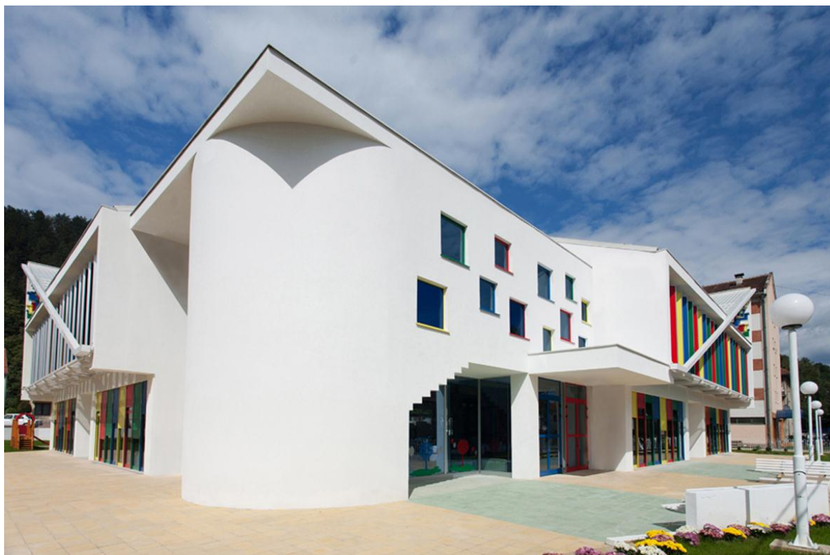
22. Đečinji vrtić - Bijelo Polje (R. Alihodžić)

Tu je nezaobilano i most »Mileni(j)um« na Morači (fotografija br. 23) - (M. Ulićević). Inače, mostovi su, pa još kako - arhitektura!