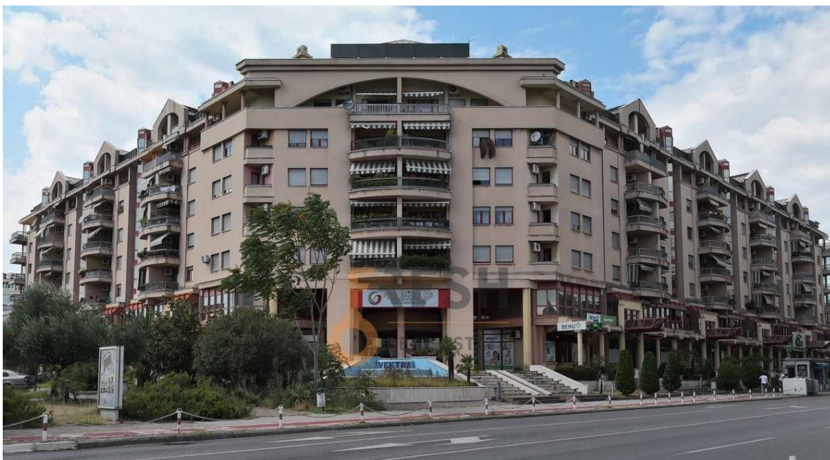
20. Stambeno-poslovna zgrada »Vektra« - Titograd (Z. Đurđević i V. Nikić)